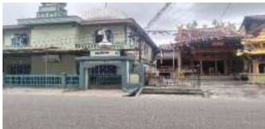
Gambar 2. Toleransi Terhadap Rumah Ibadah

Berdasarkan informasi yang peneliti dapatkan dari hasil wawancara bersama bapak Handy selaku informan dari masyarakat Tionghoa, peneliti mencoba mencari kebenaran informasi tentang toleransi terhadap keberadaan rumah ibadah selama pelaksanaan festival melalui observasi yang peneliti lakukan secara langsung. Hasilobservasi yang peneliti lakukan pada 24 Januari 2025 menunjukkan bahwa informasi tersebut adalah benar dan peneliti tampilkan dalam gambar dokumentasi hasil observasi berikut :