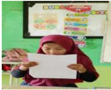
Figure 2. siswa membaca

Berdasarkan sintesis data dari pengamatan lapangan dan sesi tanya jawab, dapat disimpulkan bahwa tingkat kemampuan membaca pada siswa kelas 1 berada pada fase elementer dan sangat membutuhkan intervensi serta arahan yang terfokus. Kendala utama yang teridentifikasi mencakup: penguasaan abjad yang belum sempurna, kesulitan dalam mengasimilasi suara huruf menjadi unit suku kata, dan dominasi kebiasaan membaca dengan mengeja. Cara membaca ini menjadikan alur literasi menjadi terhambat dan tidak berkesinambungan. Di samping itu, sebagian pelajar menunjukkan defisit konsentrasi ketika diminta membaca. Kondisi ini secara langsung memperburuk daya serap mereka terhadap isi teks. Bahkan, murid yang sudah lancar membaca pun tetap menghadapi tantangan terkait fluiditas (kelancaran) dan intonasi suara saat membaca. Secara keseluruhan, temuan ini menggarisbawahi urgensi pengembangan pendekatan pengajaran membaca yang lebih terorganisasi, dukungan yang konsisten, dan upaya peningkatan dorongan (motivasi) agar kapabilitas membaca siswa dapat berprogres secara signifikan.