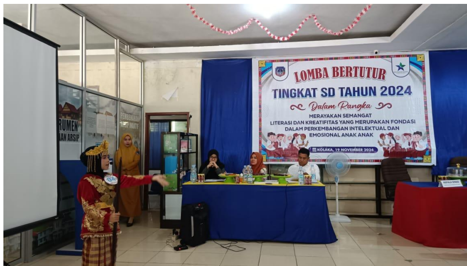
Gambar 3. Lomba bertutur tingkat SD Tahun 2024 yang diselenggarakan oleh Dinas Perpustakaan dan Kearsipan Kabupaten Kolaka (Dokumtasi peneliti, Selasa, 19 November 2024)

Dengan integrasi cerita rakyat dalam kurikulum, siswa tidak hanya akan mengenal cerita tersebut, tetapi juga memahami pentingnya menjaga warisan budaya. Langkah ini dapat membantu menciptakan generasi muda yang bangga dengan identitas budaya mereka dan memiliki rasa tanggung jawab untuk melestarikannya.