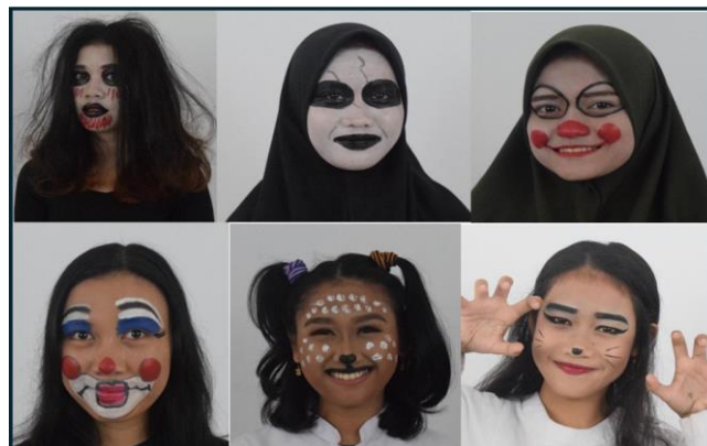
Gambar 1. Face Painting siswa kelas XI SMKN 2 Gowa sebelum menerapkan teori seni rupa

Hasil belajar siswa kelas XI SMKN 2 Gowa sebelum menerapkan teori seni rupa dalam pembelajaran Face Painting tergolong masih sangat minim. Analisis visual yang dilakukan, menunjukkan bahwa siswa masih ragu dalam menggunakan pewarna. Warna yang paling dominan yang dipakai hanya berkisar pada warna dasar atau dalam arti belum berani mencampurkan warna untuk menghasilkan warna sekunder dan tersier, alhasil hasil karya Face Painting tidak ditemukan teknik gradasi warna. Kemudian penggunaan garis juga tidak variatif hanya terpaku pada garis melingkar, garis vertikal dan hanya satu karya yang memakai garis zigzag. Di sisi lain, bentuk-bentuk yang hadir pada karya siswa selama pretest ini juga berkisar pada bentuk lingkaran, setengah lingkaran, dan sesekali bentuk menyerupai bentuk sayap.