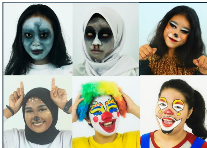
Gambar 3. Face Painting siswa kelas XI SMKN 2 Gowa setelah menerapkan teori seni rupa

Hasil belajar siswa kelas XI SMKN 2 Gowa setelah menerapkan teori seni rupa dalam pembelajaran Face Painting menunjukkan bahwa penerapan teori seni rupa dalam meningkatkan karya seni rupa Face Painting sangat efektif. Dari hasil analisis visual yang dilakukan, ditemukan bahwa siswa mampu menerapkan atau menyusun unsur-unsur seni rupa yang lebih variatif. Sebelumnya di hasil pretest masih banyak yang ragu-ragu dalam membuat berbagai kombinasi warna, dan di hasil posttest terlihat penggunaan warna lebih harmonis dengan menggabungkan beberapa warna. Dampak lainnya setelah penggunaan warna yang lebih variatif adalah terbentuknya gradasi warna atau perpindahan warna satu ke warna yang lain membuat hasil Face Painting lebih estetis dan terkesan rapi. Di sisi lain, bentuk-bentuk yang hadir juga relatif bervariasi meski tidak terlalu signifikan, akan tetapi bentuk yang tercipta terkesan lebih berbentuk atau dengan kata lain tidak asal buat. Secara keseluruhan hasil posttest menggambarkan adanya peningkatan dibandingkan dengan hasil sebelumnya saat pretest .