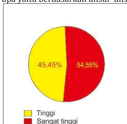
Gambar 4. Diagram lingkaran hasil posttest

Dari tabel di atas terlihat bahwa persentase rata-rata skor hasil belajar siswa setelah diterapkan kelas kelas XI SMKN 2 Gowa Setelah Penerapan diterapkan teori seni rupa adalah 85,72. Sebesar 81,81 % berada pada kategori sangat tinggi, 18,19% berada pada kategori tinggi, 0 % berada pada kategori sedang, 0 % berada pada kategori rendah dan 0 % berada pada kategori sangat rendah. Di samping itu, sesuai dengan skor rata-rata hasil belajar siswa sebesar 85,72 jika dikonversi pada tabel ternyata berada dalam kategori tinggi. Hal ini berarti bahwa rata-rata hasil belajar Face Painting siswa kelas XI SMKN 2 Gowa Setelah Penerapan Teori Seni rupa yaitu berdasarkan unsur-unsur, dan nilai estesisnya berada pada kategori tinggi. Berikut penulis sajikan diagram lingkaran untuk lebih memperjelas gambaran keadaan awal hasil belajar Face Painting siswa kelas XI SMKN 2 Gowa Setelah Penerapan Teori Seni rupa yaitu berdasarkan unsur-unsur, dan nilai estesisnya.