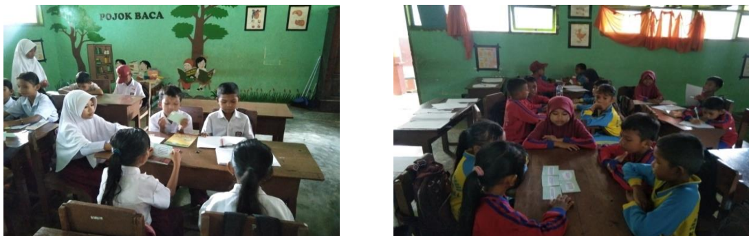
Figure 2. Pembelajaran Menggunakan Model Pembelajaran Discovery dan Media Pembelajaran Media Card Sort

Penelitian ini dilakukan sebagai upaya meningkatkan hasil belajar peserta didik dalam pembelajaran Ilmu Pengetahuan Alam dan Sosial (IPAS) materi Aku dan Kebutuhanku dengan menggunakan model pembelajaran discovery dan media pembelajaran card sort .