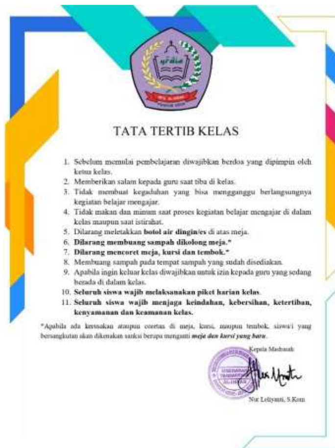
Gambar 3 Tata Tertib Kelas