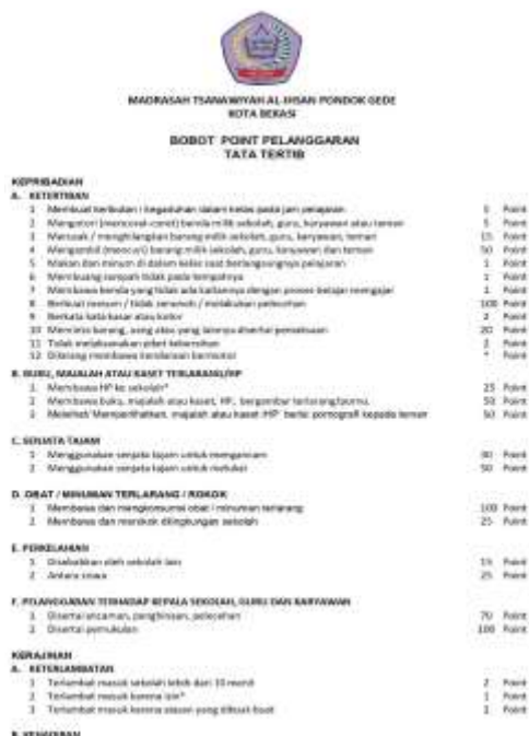
Gambar 1 Bobot Point Pelanggaran dan Tata Tertib

Dengan demikian, hasil penelitian menunjukkan bahwa kebijakan kepala sekolah tidak hanya menegakkan aturan, tetapi juga membentuk karakter siswa melalui pendekatan edukatif, religius, dan apresiatif. Kedisiplinan belajar yang tercipta berdampak langsung pada efektivitas pembelajaran serta pembentukan karakter siswa yang bertanggung jawab, jujur, dan berakhlak mulia