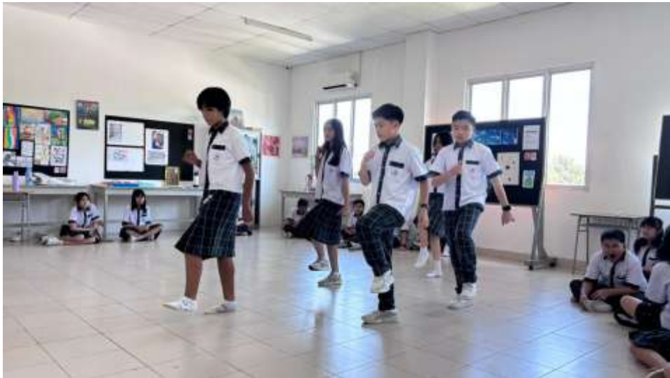
Gambar 7. Siswa menmenampilkan hasil kerja kreatifnya

Tahap ini melanjutkan proses kreatif dari eksplorasi. Siswa berlatih dan menyusun urutan gerak yang telah mereka diskusikan. Guru bertindak sebagai fasilitator, mengoreksi kesalahan dan membantu siswa merangkai koreografi menjadi satu kesatuan yang utuh. Setelah Koreografi sederhana tersebut tersusun, siswa menampilkannya di depan kelas secara berkelompok. Kelompok lain diminta untuk mengamati kelompok yang tampil sebagai bentuk apresiasi hasil kerja siswa.