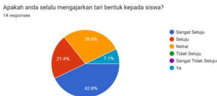
Gambar 1. Presentasi guru yang mengajarkan tari bentuk di sekolah.

Penelitian ini bertujuan untuk memahami dan menganalisis implementasi creative dance dalam pembelajaran tari di tingkat SMP se-Kota Bandar Lampung. Studi ini dimulai dengan validasi dan penyebaran kuesioner kepada guru seni budaya, yang mana 100% dari responden adalah guru dengan latar belakang pendidikan seni, sebagian besar (92.3%) berlatar belakang tari. Data awal menunjukkan keragaman pengalaman mengajar para guru, mulai dari yang baru mengajar hingga lebih dari 15 tahun, yang memberikan landasan data yang komprehensif untuk penelitian ini. Mayoritas guru mengajarkan tari bentuk (tari tradisional), sementara sebagian lainnya mengintegrasikan tari kreasi, yang menunjukkan adanya ruang bagi kreativitas siswa.