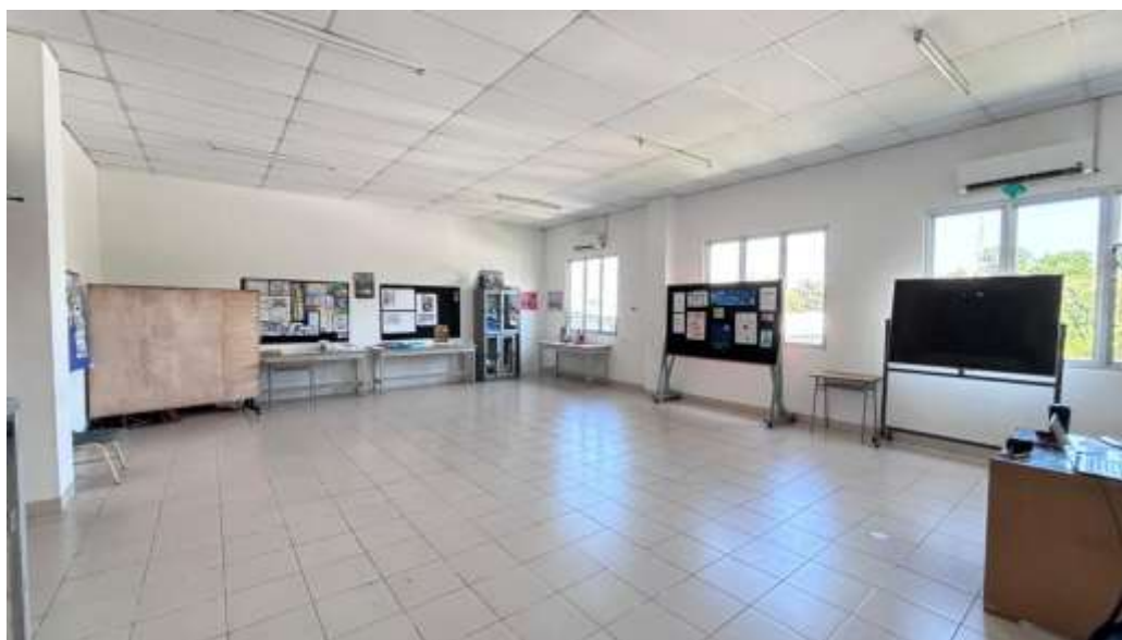
Gambar 3. Art Room SMP Pelita Bangsa Bandar Lampung

Setelah tahap pengisian kuesioner, penelitian ini berlanjut ke observasi lapangan untuk menganalisis implementasi creative dance di dalam kelas. Observasi dilakukan di SMP Pelita Bangsa Bandar Lampung, sebuah sekolah yang memberikan kebebasan kepada guru untuk merancang kurikulumnya, dengan syarat pembelajaran seni budaya harus menjadi wadah untuk mengasah kreativitas siswa. Guru mata pelajaran, Ikhsan Taufiq, S.Pd., menggunakan tari bentuk tradisional Lampung, yaitu Tari Bedana, sebagai materi pembelajaran selama satu semester. Pemilihan Tari Bedana didasarkan pada kesesuaiannya gender penari mana pun dan tidak membutuhkan properti, sehingga mempermudah proses pembelajaran. Pembelajaran Tari Bedana di SMP Pelita Bangsa dilaksanakan di sebuah ruangan khusus, Art Room , yang dirancang untuk pembelajaran seni. Ruangan ini menyediakan fasilitas yang memadai dan berada jauh dari kelas reguler, memungkinkan penggunaan audio yang optimal tanpa mengganggu siswa lain.