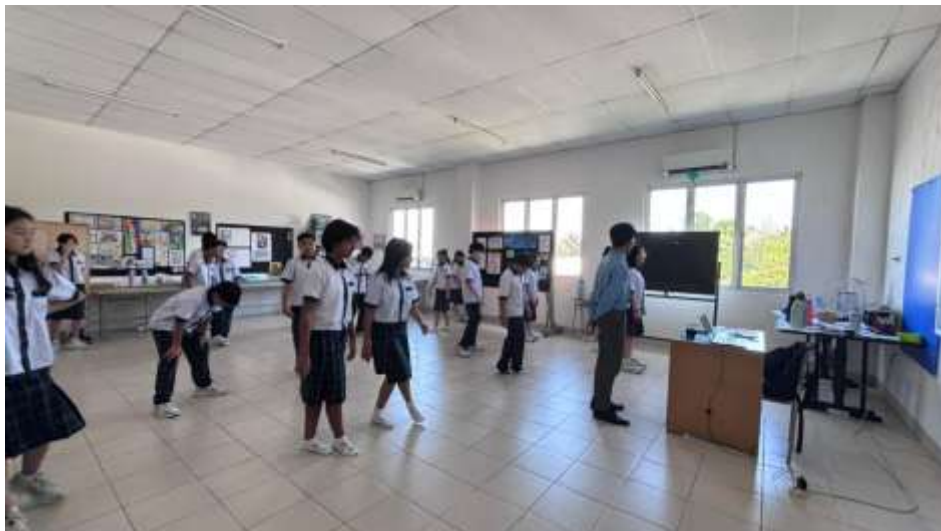
Gambar 4. Guru Memberikan contoh Gerakan kepada Siswa

Guru mengajarkan tari Bedana kepada siswa untuk memberikan pengalaman estetis dan sebagai pengetahuan mengenai kebudayaan Lampung dan wujud pelestarian. Namun guru tidak menuntut siswa untuk menguasai Teknik tari Bedana seperti layaknya seorang penari. Guru menstimulus siswa dengan mendemonstrasikan gerak belit, siswa mengamati dan menemukan teknik sendiri untuk bisa melakukannya. Cara ini berulang disetiap minggunya, karena tari melibatkan gerak anggota tubuh maka guru memustuskan untuk memberikan stimulus berupa demonstrasi gerak. Hanya dilakukan dua hingga tiga kali, lalu kemudian siswa mengamati dan mengikuti Gerakan yang diberikan oleh guru. Pada proses ini siswa dipersilakan untuk bertanya kepada guru bagian mana yang tidak jelas dan guru akan mengulangi Gerakan jika diperlukan. Setelah semua siswa bisa menggerakkan ragam gerak yang telah ditentukan maka siswa dan guru akan mencoba menggerakkan seluruh ragam gerak tari Bedana yang telah dipelajari sejak pertemuan pertama menggunakan musik pengiring.