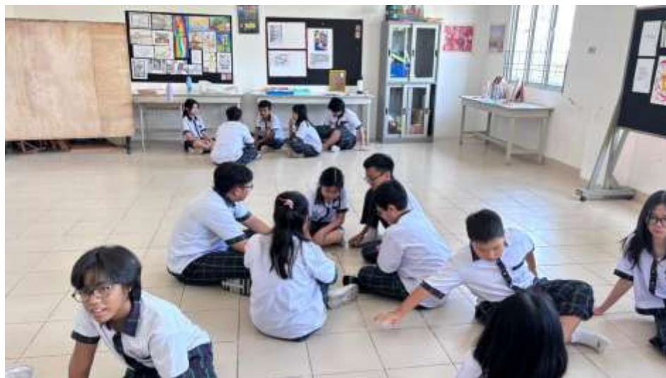
Gambar 6. Siswa mengerjakan tugas secara berkelompok

Guru membebaskan siswa untuk menyusun gerak sesuai dengan kenyamanan masing-masing. Karena pada dasarnya tidak ada aturan baku mengenai susunan gerak tari Bedana. Siswa berdiskusi selama lima menit lalu kegiatan dilanjutkan dengan Latihan berkelompok. Latihan berlangsung 20 hingga 25 menit. Dilakukan secara berulang oleh siswa agar seluruh anggota kelompok hafal urutan gerak yang telah ditentukan dan teknik gerak dapat dilakukan dengan benar.