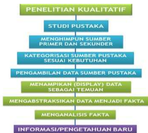
Gambar 1. Desain Penelitian Kualitatif (Darmalasana, 2020)

Jenis penelitian ini adalah fenomenologi dengan tingkat eksplorasi kualitatif. Pendekatan penelitian yang akan peneliti lakukan dalam penelitian ini yaitu pendekatan penelitian kualitatif dengan jenis penelitian yaitu penelitian fenomenologi. Dalam penelitian ini data penelitian diperoleh secara langsung dari lapangan dan subyeknya diperoleh secara alamiah ( natural setting ). Melalui studi pustaka, menghimpun sumber primer dan sekunder, mengorganisasikan mengambil data, display data, dan menganalisis data (Darmalasana, 2020).