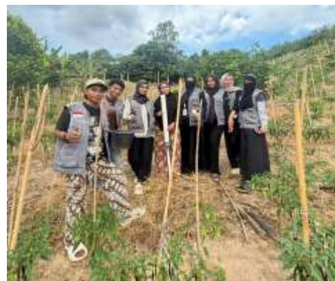
Gambar 3.2 UMKM Hasil Pertanian Lombok