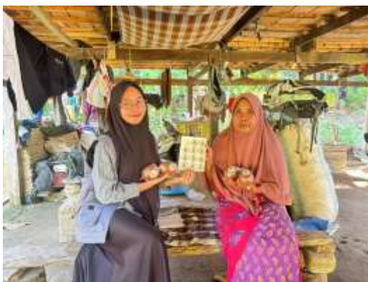
Gambar 3.1 UMKM Hasil Gula Merah