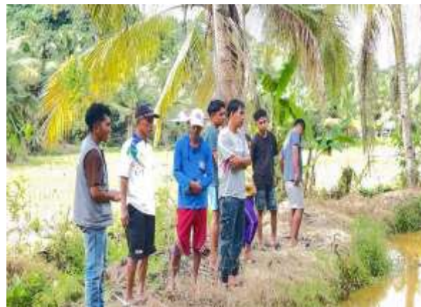
Gambar 3.3 UMKM Hasil Ikan Lele

Berdasarkan data pra-pelatihan (pre-test) dan pasca-pelatihan (post-test) terhadap 25 pelaku UMKM Pondouwae, ditemukan bahwa rata-rata skor literasi finansial meningkat dari 55% menjadi 78% , sedangkan skor literasi digital meningkat dari 48% menjadi 74% . Tabel 1 merangkum perubahan persentase pada beberapa kompetensi spesifik: pengelolaan arus kas, pencatatan keuangan, penggunaan platform e-commerce, pemasaran digital, dan keamanan data digital.