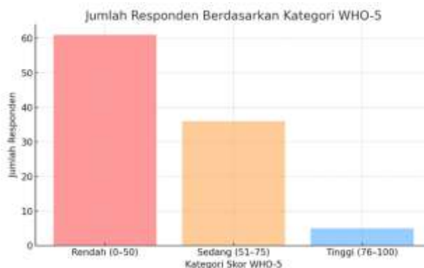
Gambar 2. Diagram Batang Jumlah Responden per Kategori WHO-5

risiko gangguan kesehatan mental. Sebanyak 35,3% berada dalam kategori sedang, dan hanya 4,9% yang tergolong dalam kategori tinggi (>75).