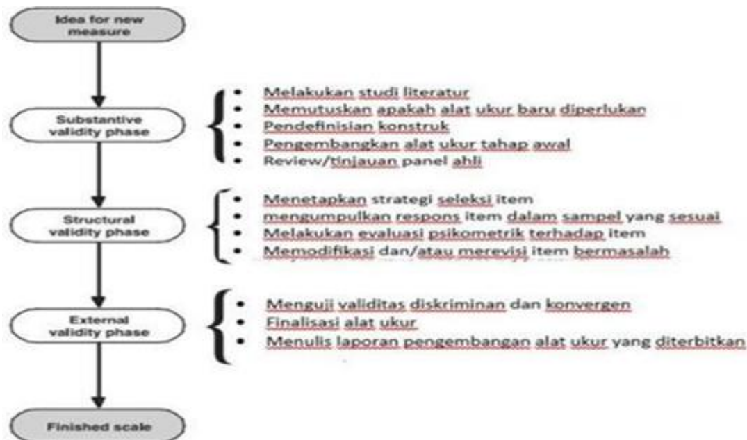
(Gambaran Tahapan Kontruksi)

Metode yang digunakan di dalam penulisan artikel ini yaitu pendekatan kuantitatif dengan jenis penelitian pengembangan instrumen atau kontruksi alat ukur psikologi. Pendekatan ini dipilih karena tujuan utama penelitian adalah untuk mengembangkan dan menguji properti psikometrik dari instrumen academic self-efficacy yang disusun berdasarkan teori Bandura (1997, 2006). Penelitian ini dilaksanakan pada tanggal 4-11 Mei 2026 di lingkungan Universitas Islam Negeri Sunan Gunung Djati Bandung. Pemilihan lokasi ini didasarkan pada pertimbangan aksesibilitas dan kesesuaian dengan target populasi penelitian, yaitu mahasiswa aktif yang sedang menempuh perkuliahan dan menghadapi berbagai tuntutan akademik.