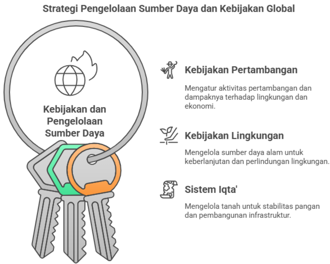
Tabel 1. "Kebijakan Pengelolaan Sumber Daya Alam dalam Hukum Tata Negara: Perbandingan antara Indonesia, Uni Eropa, dan Kebijakan Ekonomi pada Masa Harun ar-Rasyid"

lembaga yang kuat. Dengan langkah-langkah ini, Indonesia dapat meningkatkan pengelolaan SDA yang lebih efektif, adil, dan berkelanjutan, demi kemashlahatan bangsa.