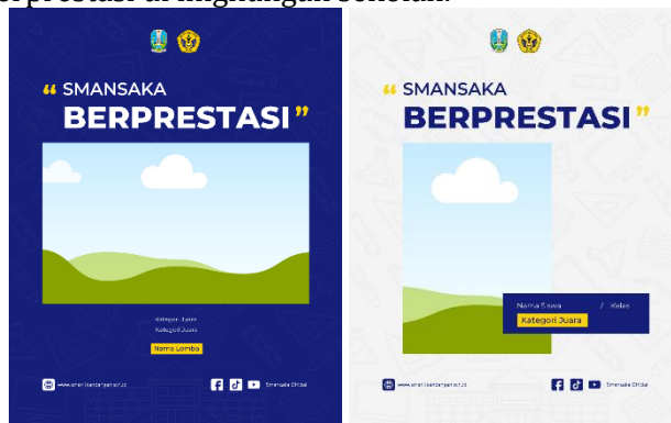
Gambar 8. Template Desain Konten Smansaka Berprestasi

bagi seluruh warga sekolah untuk terus mengembangkan potensi dan kompetensinya. Dengan demikian, konten ini tidak hanya berperan dalam membangun reputasi institusi, tetapi juga dalam mendorong budaya berprestasi di lingkungan sekolah.