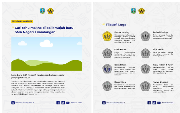
Gambar 5. Implementasi Desain Konten Seputar Smansaka

Pada konten Seputar Smansaka nantinya dibagikan unggahan yang lebih casual. Informasi dalam konten ini memuat fakta-fakta menarik, fasilitas yang terdapat pada sekolah, hingga konten interaktif bersama dengan warga sekolah. Konten dapat dikemas dalam bentuk unggahan feeds-carousel maupun video reels. Penyajian informasi dengan pendekatan casual bertujuan untuk membangun kedekatan emosional antara sekolah dan audiens, sekaligus meningkatkan engagement melalui format visual yang lebih dinamis, partisipatif, dan mudah diakses sesuai dengan karakteristik media sosial modern.