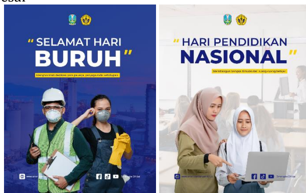
Gambar 9. Implementasi Desain Konten Peringatan Hari Besar

Dalam memperingati hari besar nasional, akun Instagram resmi sekolah turut serta membagikan unggahan yang relevan dengan momentum tersebut. Kegiatan ini bertujuan untuk meningkatkan rasa nasionalisme di kalangan warga sekolah serta membangun citra institusi yang aktif dan peduli terhadap nilai-nilai kebangsaan. Unggahan dikemas secara komunikatif dan menarik, dengan mempertimbangkan aspek estetika dan identitas visual sekolah, sehingga mampu menarik perhatian audiens dan memperkuat hubungan emosional antara sekolah dan masyarakat luas.