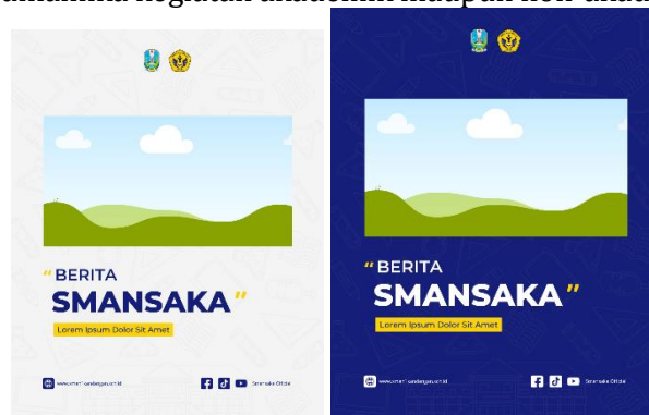
Gambar 4. Template Desain Konten Berita Smansaka

Konten yang nantinya dibagikan pada Berita Smansaka yaitu mengenai penyampaian informasi kegiatan yang akan berlangsung, dan rekap kegiatan yang telah dilaksanakan. Konten dikemas melalui desain yang komunikatif dan atraktif, dengan memanfaatkan elemen visual yang merepresentasikan identitas sekolah. Penyusunan konten ini bertujuan untuk meningkatkan keterlibatan audiens serta memperkuat hubungan antara sekolah dengan seluruh warga sekolah maupun masyarakat umum. Selain itu, pendekatan visual yang konsisten dan informatif diharapkan mampu membangun citra institusi pendidikan yang aktif dan responsif terhadap berbagai dinamika kegiatan akademik maupun non-akademik.