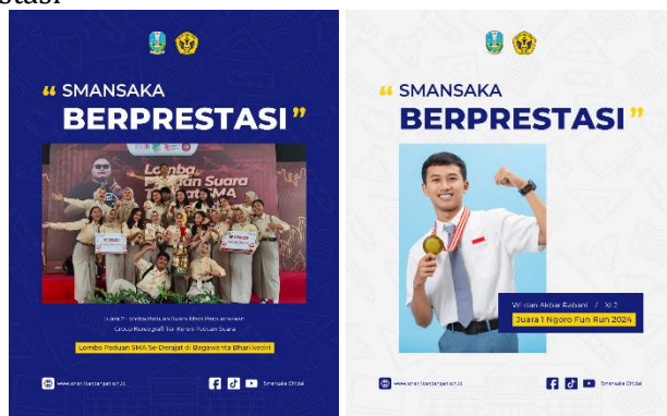
Gambar 7. Implementasi Desain Konten Smansaka Berprestasi

Pada konten Smansaka Berprestasi nantinya dibagikan prestasi yang telah diraih oleh warga sekolah, baik siswa hingga guru. Melalui konten ini, dapat disampaikan kepada audiens citra sekolah yang berprestasi. Citra ini penting untuk dibangun guna meningkatkan kepercayaan publik terhadap kualitas lembaga pendidikan. Selain itu, penyampaian informasi prestasi juga berfungsi sebagai bentuk apresiasi terhadap individu berprestasi serta motivasi