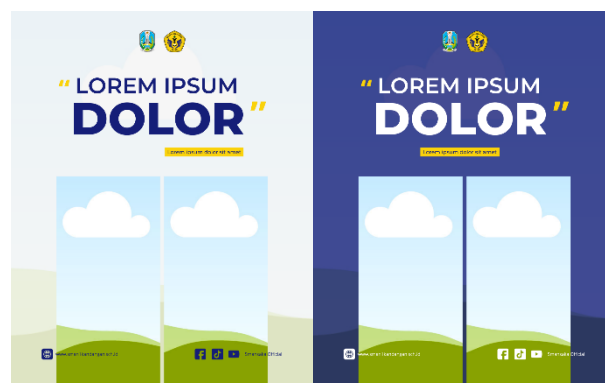
Gambar 10. Template Desain Konten Peringatan Hari Besar

Dalam memperingati hari besar nasional, akun Instagram resmi sekolah turut serta membagikan unggahan yang relevan dengan momentum tersebut. Kegiatan ini bertujuan untuk meningkatkan rasa nasionalisme di kalangan warga sekolah serta membangun citra institusi yang aktif dan peduli terhadap nilai-nilai kebangsaan. Unggahan dikemas secara komunikatif dan menarik, dengan mempertimbangkan aspek estetika dan identitas visual sekolah, sehingga mampu menarik perhatian audiens dan memperkuat hubungan emosional antara sekolah dan masyarakat luas.