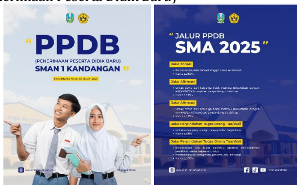
Gambar 11. Implementasi Desain Konten PPDB

Pada pertengahan tahun menjelang awal semester baru, setiap satuan pendidikan menyelenggarakan kegiatan wajib yakni Penerimaan Peserta Didik Baru (PPDB). Kegiatan ini merupakan salah satu agenda strategis sekolah yang bertujuan untuk menjaring calon peserta didik baru sesuai dengan kuota dan kriteria yang telah ditentukan. Pemanfaatan media sosial, khususnya akun Instagram resmi sekolah, menjadi salah satu sarana efektif dalam menyampaikan informasi terkait PPDB secara luas, cepat, dan mudah dijangkau oleh masyarakat.