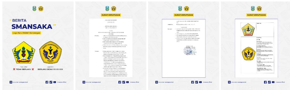
Gambar 3. Implementasi Desain Konten Berita Smansaka

Konten yang nantinya dibagikan pada Berita Smansaka yaitu mengenai penyampaian informasi kegiatan yang akan berlangsung, dan rekap kegiatan yang telah dilaksanakan. Konten dikemas melalui desain yang komunikatif dan atraktif, dengan memanfaatkan elemen visual yang merepresentasikan identitas sekolah. Penyusunan konten ini bertujuan untuk meningkatkan keterlibatan audiens serta memperkuat hubungan antara sekolah dengan seluruh warga sekolah maupun masyarakat umum. Selain itu, pendekatan visual yang konsisten dan informatif diharapkan mampu membangun citra institusi pendidikan yang aktif dan responsif terhadap berbagai dinamika kegiatan akademik maupun non-akademik.