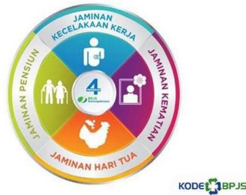
Gambar 1.1 Empat Program Jamsostek

34 ayat 2, yang kini berbunyi: "Negara mengembangkan sistem jaminan sosial bagi seluruh rakyat dan memberdayakan masyarakat yang lemah dan tidak mampu sesuai dengan martabat kemanusiaan". 9 Manfaat perlindungan tersebut dapat memberikan rasa aman kepada pekerja sehingga dapat lebih berkonsentrasi dalam meningkatkan motivasi maupun produktivitas kerja.