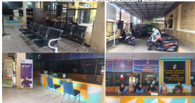
Gambar 1 Bukti dukung fisik

Berdasarkan tabel 4 diatas terkait indikator Tangibilitas atau bukti fisik dan bukti dukung pada gambar 1 diatas bahwa Kecamatan Limapuluh Kota Pekanbaru dalam unsur fisik pelayanan sudah melakukan evaluasi dengan baik sesuai dengan standar pelayanan dasar.