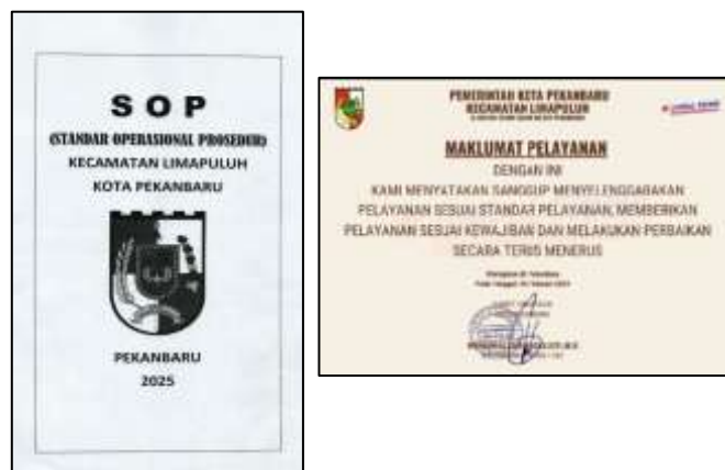
Gambar 2 Bukti dukung fisik

Sumber data :Dokumen Penilaian Pelayanan Kecamatan