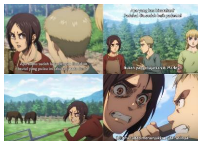
Figure 2 Runtutan adegan Gabi berusaha menyerang Kaya yang seorang ras Eldia karena ketahuan sebagai penyusup dari negara Marley

Selain stigma kotoran yang melekat, ras Eldia juga mengalami demonisasi. Demonisasi adalah strategi wacana politik dengan melibatkan penggambaran individu atau kelompok sebagai sesuatu yang jahat dan mengerikan, untuk mendapatkan keuntungan (Richard, 2021) Demonisasi dilakukan secara sistematis oleh pemerintahan Marley sehingga masyarakat negara Marley terpengaruh dan semakin menyudutkan posisi ras Eldia yang tinggal di negara Marley. Strategi ini berhasil memecah belah ras Eldia sehingga Marley mendapatkan keuntungan berupa mengeksploitasi hidup ras Eldia demi keuntungan negara Marley. Hal tersebut dapat tergambar dalam adegan berikut ini.