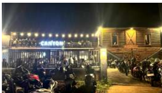
Figure 1. Canyon Coffee

Di Canyon Coffee di Piayu, Kecamatan Sei Beduk, fenomena menarik telah muncul. Karena jaraknya yang relatif jauh dari pusat kota, Piayu bukanlah tempat yang ideal untuk sebuah kafe. Namun, berbeda dengan kafe-kafe lain di sekitarnya, Canyon Coffee berhasil bertahan, berkembang, dan bahkan menarik banyak pelanggan. Mengingat produk andalannya, Mix Platter, situasi ini menimbulkan pertanyaan tentang apa yang membuatnya begitu populer. Namun, karena konsumen local (domisili kecamatan Sei Beduk) dan pelanggan non-local (domisili luar kecamatan Sei Beduk) berasal dari latar belakang yang berbeda, mungkin tidak ada persetujuan yang konsisten terhadap menu ini. Sementara pelanggan non-local membawa pengalaman dari tempat lain, pelanggan local mungkin menilai berdasarkan konvensi dan preferensi lokal (Warde and Martens 2000).