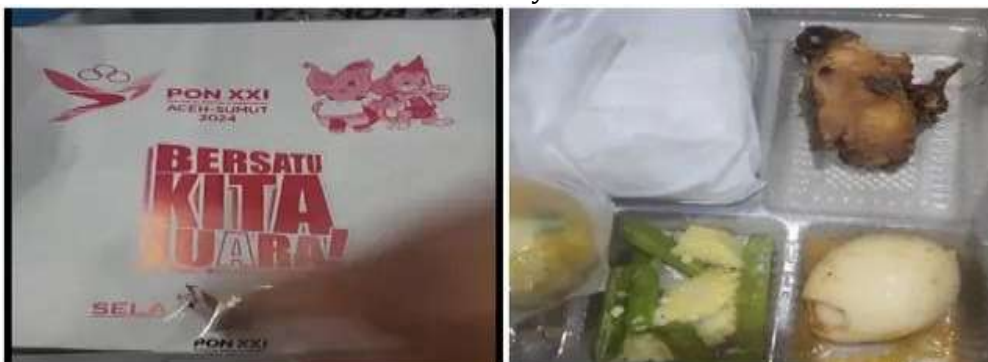
Gambar 1. Menu konsumsi PON XXI Aceh-Sumut