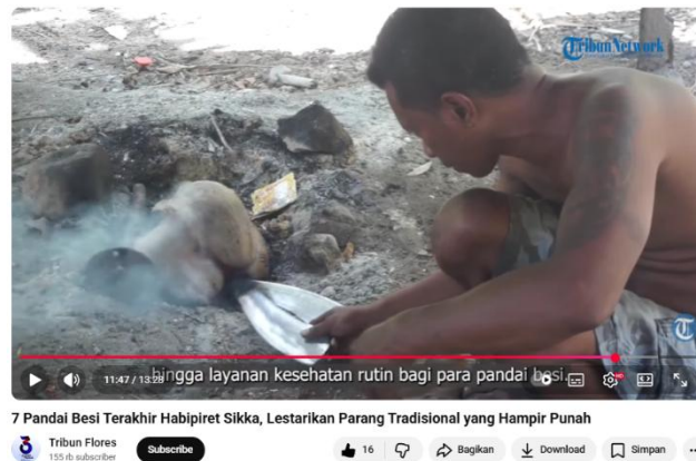
Gambar 8. Seorang pandai besi sedang memasukan besi parang ke bara api

Dari sisi maskulinitas, visual ini merepresentasikan kekuatan yang terkendali dan ketajaman fokus melalui tangan yang stabil dalam mengendalikan alat-alat berat di atas landasan besi yang masif. Penggunaan celana jin yang robek dan pakaian kerja yang sederhana mempertegas identitas maskulin yang tidak mementingkan penampilan luar, melainkan mengedepankan fungsionalitas dan ketangguhan fisik dalam melakukan pekerjaan yang penuh risiko, sekaligus melambangkan peran laki-laki sebagai sosok yang mampu mengubah materi mentah menjadi alat yang berdaya guna bagi komunitasnya.