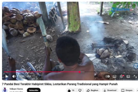
Gambar 6. Pandai besi memasang gagang ke parang

Pada gambar 6, memperlihatkan pandai besi memasang gagang ke parang. Komposisi secara visual dipandu oleh garis diagonal yang kuat. Garis ini ditarik dari punggung pekerja di bagian bawah tengah, bergerak naik mengikuti arah parang yang dipegang, menuju tumpukan sabut kelapa di kiri atas serta kepulan asap di kanan atas. Pengambilan sudut pandang dari atas punggung ( over the shoulder ) menciptakan kedalaman ruang ( depth ) yang nyata, memisahkan lapisan latar depan (tubuh pekerja), lapisan tengah (proses kerja), dan latar belakang (lingkungan sekitar). Komposisi ini merepresentasikan hubungan intim antara pencipta dan ciptaannya. Maskulinitas dalam scene ini tidak ditampilkan secara frontal melalui wajah, melainkan melalui anonimitas kerja. Dengan menempatkan kamera di belakang subjek, penonton diajak untuk melihat dunia melalui sudut pandang sang pengrajin.