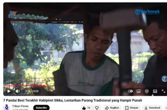
Gambar 4. Saat pandai besi (subjek utama) diperlihatkan sedang menempa parang.

Pada gambar 4, memperlihatkan momen fokus tinggi saat proses penempaan besi sedang berlangsung. Dalam frame ini, wajah pria di bagian tengah diisolasi sebagai golden mean area atau titik pusat perhatian utama untuk mengunci emosi penonton. Elemen visual diatur sebagai berikut: Titik Pusat: diisi oleh ekspresi tenang namun tajam dari sang pandai besi yang berada tepat di area fokus utama. Latar Depan (Foreground): sebuah palu besar yang sedikit blur menciptakan bingkai alami yang mengarahkan mata langsung kepada subjek.