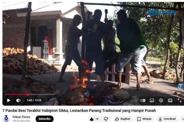
Gambar 1. Para pandai besi bekerja sama menempa besi

Pada gambar 1, memperlihatkan aktivitas sehari-hari para pandai besi yakni bekerja sama menempa besi. Dalam frame ini, tidak ada satu figur yang ditempatkan sebagai pusat tunggal. Tubuh para pandai besi tersebar pada titik-titik kuat rule of thirds: Sepertiga kiri: tumpukan material (bahan baku) dan tungku api sebagai sumber energi. Sepertiga tengah: aktivitas menempa, titik benturan palu dan besi panas. Sepertiga kanan: tubuh-tubuh pekerja yang saling berdekatan, saling mengisi peran. Komposisi ini menolak heroisme individual dan justru membangun maskulinitas kolektif, di mana kekuatan tidak dimiliki satu orang, melainkan lahir dari kerja bersama.