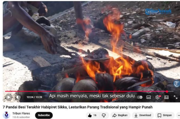
Gambar 3. Tangan pandai besi yang sedang membakar besi parang

Pada gambar 3, memperlihatkan aktivitas proses pembakaran besi parang. Menempatkan elemen krusial yaitu kobaran api dan tangan sang pengrajin pada titik potong dan garis vertikal di sisi kanan layar, memberikan keseimbangan visual sekaligus memandu mata penonton untuk fokus pada pusat aksi penempaan. Penempatan ini menciptakan ruang di sisi kiri yang memperlihatkan konteks lingkungan kerja yang autentik.