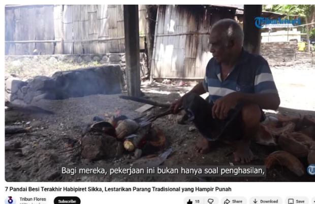
Gambar 2. Sosok Pandai besi senior yang sedang membakar besi parang

Maskulinitas dalam scene ini direpresentasikan melalui: Tubuh yang berkeringat, Gerak repetitif, Kedekatan dengan api dan risiko. Tidak ada dialog dominan, tidak ada ekspresi emosional yang diekspos. Maskulinitas dibangun sebagai ketahanan diam (silent endurance) bahwa lelaki yang berbicara melalui kerja, bukan kata.