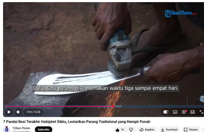
Gambar 9. Tangan pandai besi sedang mengasah parang dengan muncul nya percikan api

Pada gambar 9, memperlihatkan tangan pandai besi sedang mengasah parang, Garis diagonal pada foto tersebut tercipta melalui kemiringan posisi parang yang membentang dari kiri bawah ke arah kanan tengah, yang secara teknis berfungsi menciptakan dinamika visual, kedalaman ruang ( depth ), dan mengarahkan mata penonton langsung ke titik pusat aksi yaitu gesekan gerinda. Secara semiotika, komposisi diagonal ini mempertegas makna maskulinitas melalui kesan kekuatan, keberanian, dan dominasi fisik; di mana posisi tangan yang menekan alat secara miring melambangkan kontrol penuh seorang pria dalam menaklukkan material besi yang keras. Percikan api yang muncul di sepanjang garis diagonal tersebut menjadi simbol etos kerja yang tangguh dan agresif, merepresentasikan sosok pria sebagai "penempa" yang tidak hanya mengandalkan otot, tetapi juga keahlian presisi dalam menjaga warisan budaya yang hampir punah.