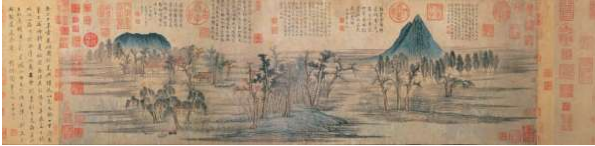
Gambar 1. Autumn Colors on the Que and Hua Mountains by Zhao Mengfu (1254-1322). Ink on paper. 28.4 x 93.2 cm

Sumber: https://smarthistory.org/zhao-mengfu-autumn-colors-mountains/