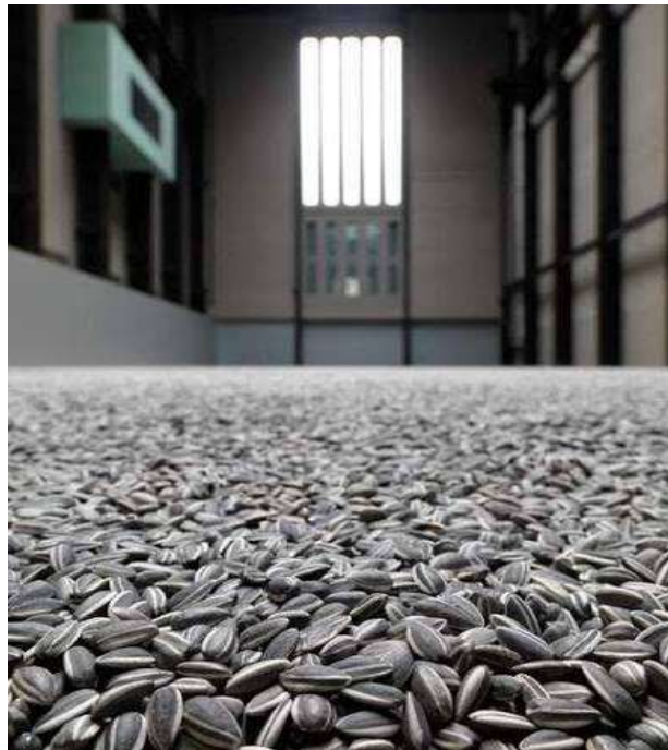
Gambar 3. Sunflower Seeds (Kui Hua Zi) by Ai Weiwei 2010