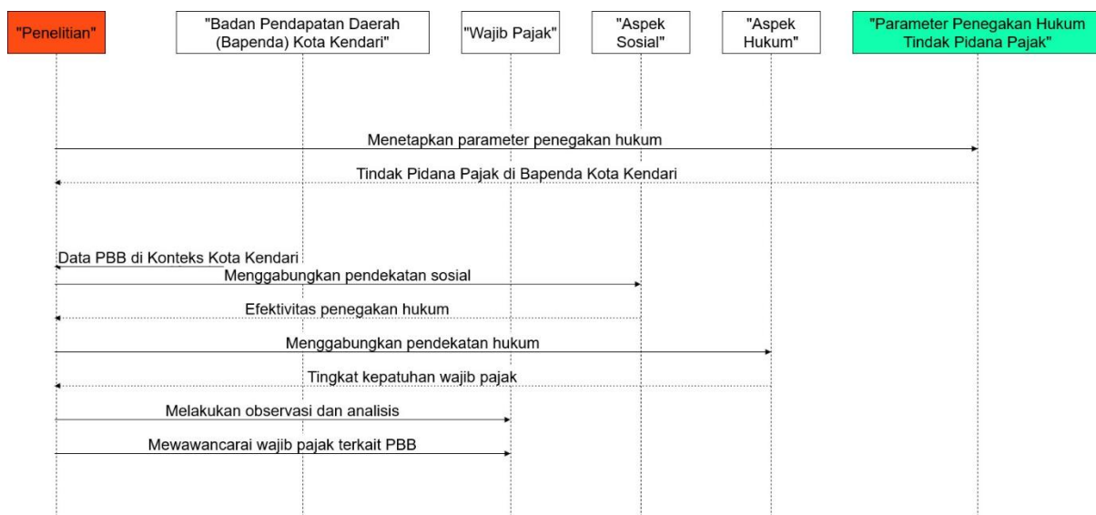
Gambar 4.1 Alur Penelitian

Kemudian, penelitian ini juga menganalisis penerapan teknologi dan sistem informasi dalam penegakan hukum pajak. Integrasi teknologi dalam penegakan hukum pajak telah diatur dalam berbagai peraturan, yang menekankan perlunya pemanfaatan teknologi untuk meningkatkan efisiensi serta responsivitas dalam menangani kasus terkait PBB. Ini menjadi penting untuk menyesuaikan sistem perpajakan dengan era digital saat ini.