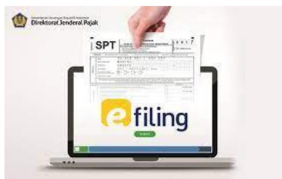
Gambar 4.2 Aplikasi E-Filing

Dalam era digital yang terus berkembang, inovasi dalam sistem perpajakan menjadi kunci untuk memudahkan masyarakat dalam memenuhi kewajiban pajak. Dua solusi terbaru yang meraih perhatian adalah aplikasi e-Filing dan Klik Pajak. e-Filing, sebuah platform penyelenggaraan pelaporan pajak elektronik, memungkinkan wajib pajak untuk mengisi formulir pajak secara digital, menggantikan proses manual yang kompleks. Di sisi lain, Klik Pajak memberikan kemudahan pembayaran pajak secara daring, meminimalkan kerumitan dalam transaksi keuangan yang terkait dengan kewajiban pajak.