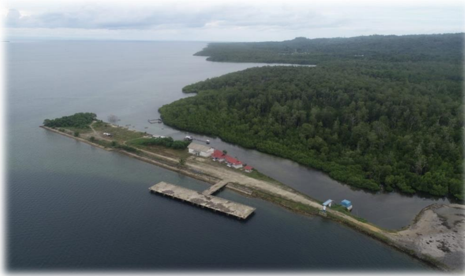
Gambar 2 Kondisi Eksisting Pelabuhan Nambo

Hasil observasi dan pengukuran menemukan bahwa pelabuhan Nambo berada kurang lebih 200 meter dari area pemukiman di Desa Nambo. Hasil pengamatan yang dilakukan peneliti menemukan bahwa wilayah di belakang area Pelabuhan Lawele merupakan area hutan produksi serta ada bagian pelabuhan yang bersinggungan langsung dengan wilayah hutan mangrove. Area beaching yang terdapat di dekat Pelabuhan Nambo merupakan lahan yang dimiliki oleh Pemerintah Daerah.