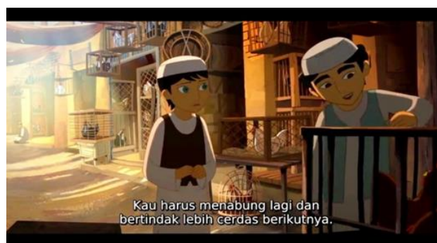
Gambar 6. Adegan pada menit 47.13 dalam film The Breadwinner

Atas saran Shauzia, gadis muda lainnya yang menyamar sebagai laki-laki, Parvana mencoba menyuap penjaga penjara agar dia bisa melihat ayahnya. Namun, penjaga menyuruhnya pergi. Dia bekerja untuk menabung lebih banyak uang untuk suap yang lebih besar, Pada adegan dialog diaman shauzia mengatakan “kau harus menabung lagi dan bertindak lebih cerdas berikutnya” kepada Parvana, memiliki pesan bahwa bekerja untuk mencari uang akan sia-sia jika tidak digabungkan dengan menabung. Islam mengajarkan umatnya untuk menabung. Hal tersebut dijelaskan dalam hadist riwayat Bukhari bahwa, “simpanlah sebagian dari harta kalian untuk kebaikan masa depan kalian, karena itu jauh lebih baik” (Prudential, 2024).