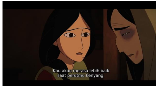
Gambar 2. Adegan pada menit 19.43 dalam film The Breadwinner

Pada adegan diatas dengan dialog Soraya yang mengatakan “Kau akan merasa lebih baik saat perutmu kenyang” kepada Fattima, menggambarkan perhatian seorang anak kepada ibunya. Kalimat tersebut menjadi penenang disaat pikiran hampa dan meredakan rasa sakit secara fisik maupun psikologis yang dialami oleh Fattima. Tanpa disadari kalimat tersebut memiliki sebuah makna mendalam tentang rasa cukup terhadap kebutuhan manusia. Secara nyata memberikan dorongan untuk bertahan hidup bahwa selama kita masih memiliki makanan maka kita akan baik-baik saja. Terlihat dari komunikasi Soraya dan Fattima memberikan gambaran bahwa rasa kasih sayang tumbuh seiring dengan berjalannya waktu, baik dari orangtua kepada anak, maupun sebaliknya. Rasa kasih sayang akan terbentuk dan berkembang berdasarkan hubungan dan interaksi yang saling mendukung serta membangun. Hal tersebut memberikan perasaan ingin menjaga, melindungi, dan mendukung orangtua dalam segala hal, baik dalam kondisi fisik maupun emosional.