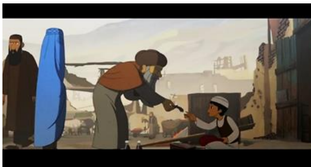
Gambar 4. Adegan pada menit 40.38 dalam film The Breadwinner

Di tengah ramainya pasar dengan penampilan seperti laki-laki, Parvana dapat berdagang, bernegosiasi dengan pembeli maupun pedagang lain dan menghasilkan uang di Pasar. Sebagai anak perempuan, Parvana tidak mudah menyerah dan memiliki semangat juang yang tinggi dalam mencapai tujuannya. Pada adegan tersebut, menggambarkan kerja keras seorang anak sebagai pencari nafkah. Menunjukkan bahwa perempuan dapat melakukan kegiatan ekonomi dan menjadi breadwinner atau pencari nafkah yang biasanya diemban oleh laki-laki. Parvana mahir dalam melakukan tawar menawar dengan para pembeli dan penjual di Pasar serta menghasilkan uang, untuk memenuhi kebutuhan keluarganya.