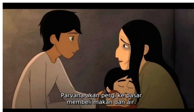
Gambar 3. Adegan pada menit 24.46 dalam film The Breadwinner

Persediaan makanan semakin sedikit. Parvana mencoba membeli makanan untuk keluarganya, namun para pedagang asongan tidak bisa menjualnya karena takut pada Taliban. Untuk menghidupi keluarganya, dia memutuskan untuk memotong rambut dan berpakaian seperti laki-laki. Soraya menghargai keputusannya dan membantu merapikan potongan rambut Parvana. Dia mulai menyebut dirinya "Aatish", dan mengaku sebagai keponakan Nurullah. Rencananya berhasil, dan Parvana bisa membeli makanan dan mendapatkan uang.