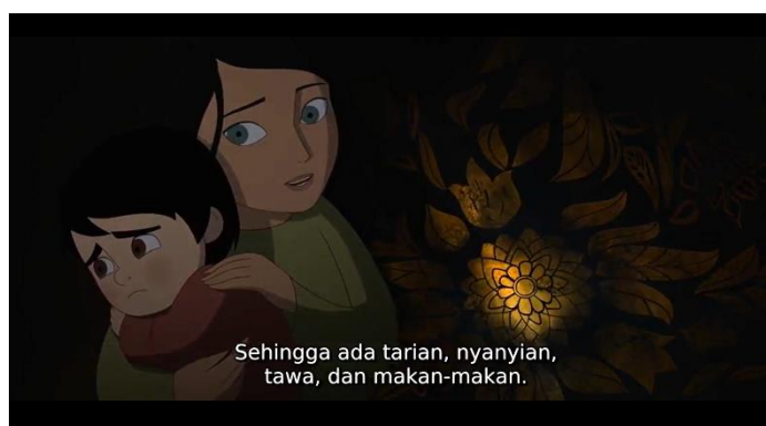
Gambar 7. Screenshot adegan pada menit 17.53 dalam film The Breadwinner

Seperti anak kecil pada umumnya, Parvana adalah seorang anak perempuan yang imajinatif dan gemar bercerita pada keluarga dan teman-temannya. Parvana sdlalu menghibur Zaki dengan menceritakan kisah seorang anak laki-laki yang berupaya mengambil benih desanya dari Raja Gajah yang jahat. Imajinasi dan pengetahuan yang diungkapkan melalui narasi merupakan unsur yang cukup signifikan dan muncul secara konsisten pada film the breadwinner guna memberikan gambaran dari keberanian dan ketangguhan para tokoh-tokoh film dalam menghadapi berbagai kesulitan dan tantangan kondisi hidup yang sangat berat di Afghanistan.