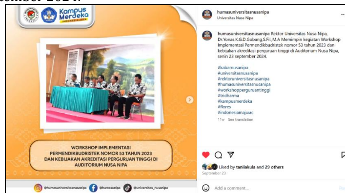
Gambar 3. Postingan Akun Instagram @humasuniversitasnusanipa 23 September 2024