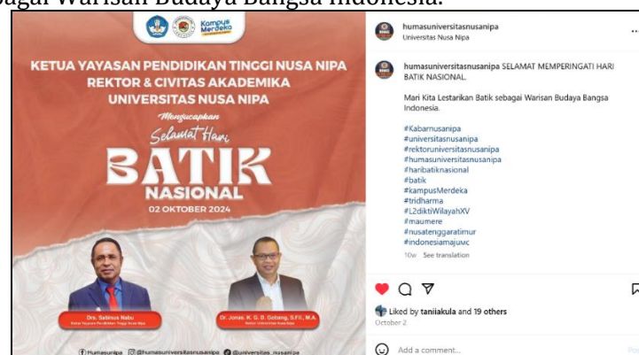
Gambar 8. Postingan Akun Instagram @humasuniversitasnusanipa 2 Oktober 2024