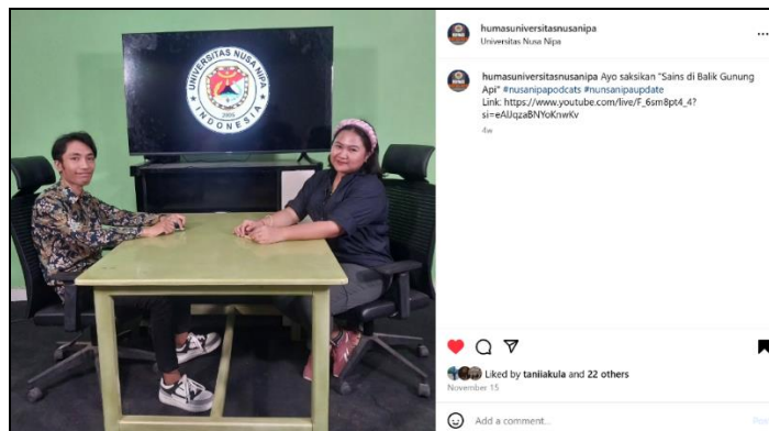
Gambar 12. Postingan Akun Instagram @humasuniversitassusanipa 15 November 2024