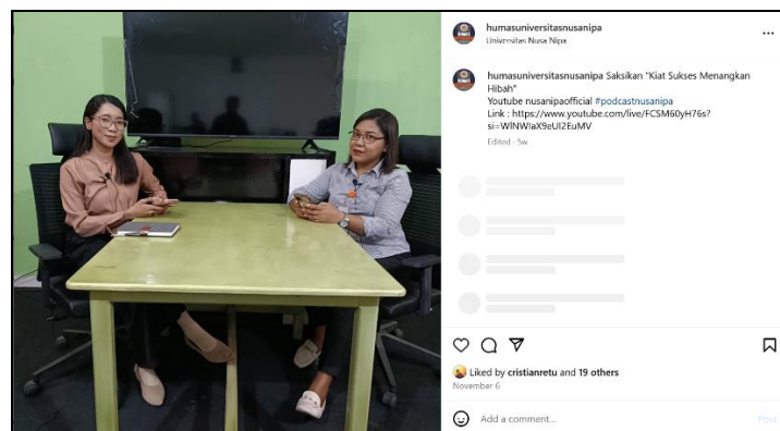
Gambar 10. Postingan Akun Instagram @humasuniversitASNUSANIPA 6 November 2024