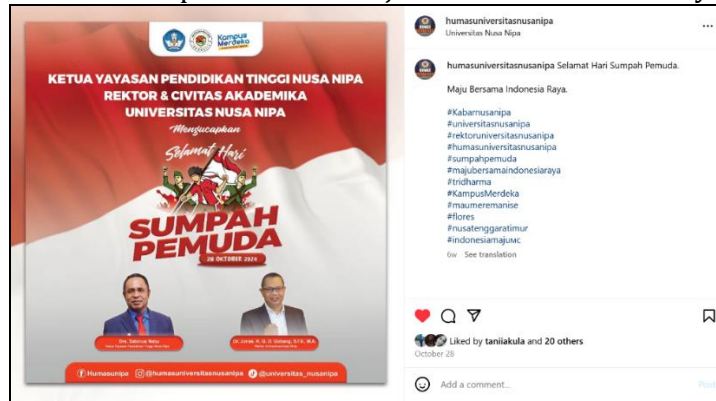
Gambar 9. Postingan Akun Instagram @humasuniversitASNUSANIPA 28 Oktober 2024