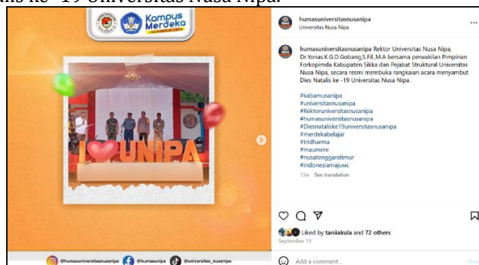
Gambar 1. Postingan Akun Instagram @humasuniversitassusanipa 13 September 2024