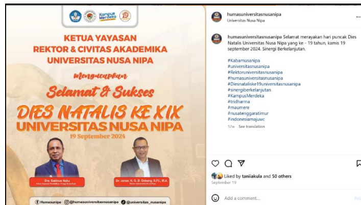
Gambar 2. Postingan Akun Instagram @humasuniversitasnusanipa 19 September 2024