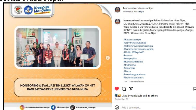
Gambar 4. Postingan Akun Instagram @humasuniversitasnusanipa 26 September 2024