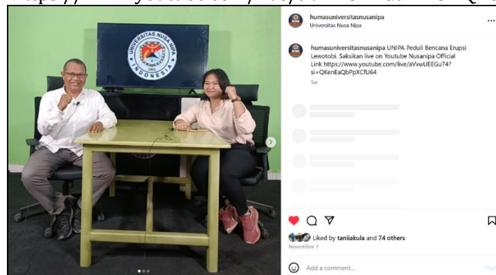
Gambar 11. Postingan Akun Instagram @humasuniversitASNUSANIPA 7 November 2024