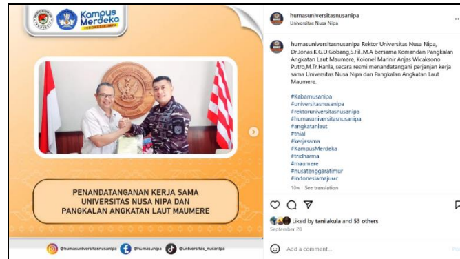
Gambar 5. Postingan Akun Instagram @humasuniversitasnusanipa 28 September 2024