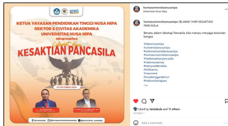
Gambar 7. Postingan Akun Instagram @humasuniversitasnusanipa 1 Oktober 2024