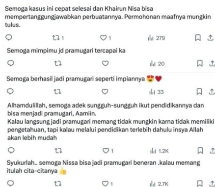
Gambar 4. Respons Netizen pada Unggahan Klarifikasi di Twitter/X

bertanggung jawab, seperti pelaku penipuan atau sistem yang memungkinkan terjadinya kejadian tersebut. Fenomena ini sejalan dengan temuan penelitian yang menunjukkan bahwa solidaritas digital sering kali muncul sebagai respons kolektif terhadap persepsi ketidakadilan, yang diperkuat oleh interaksi sosial di media digital (Kajta et al., 2025).