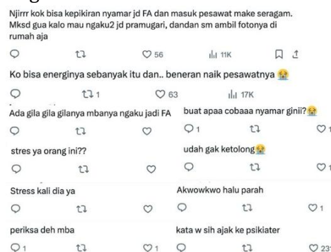
Gambar 2. Respons Netizen di Unggahan Twitter/X

Akibat dari kondisi tersebut, netizen cenderung membangun persepsi negatif terhadap individu yang bersangkutan dan merespons dengan agresi kolektif. Hal ini terlihat dari munculnya komentar bernada ejekan, kritik tajam, hingga penghakiman moral yang dilakukan secara masif. Respons ini tidak hanya bersifat individual, tetapi berkembang menjadi pola kolektif yang saling memperkuat melalui interaksi antar pengguna. Fenomena ini menunjukkan bahwa media sosial dapat menjadi ruang yang memperkuat diskursus toksik dan agresi verbal, terutama ketika isu yang berkembang bersifat kontroversial dan emosional (Pascual-Ferrá et al., 2021).