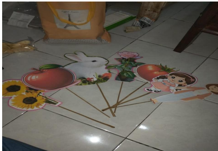
Gambar 2. Media Wayang Kertas Yang Dikembangkan

Tahap kedua adalah merancang. Pada tahap ini, analisis yang telah dilakukan digunakan untuk merancang media wayang kertas. Dalam desain media, tokoh-tokoh dalam cerita Lisa dan ibunya pergi ke hutan yang indah dikumpulkan, kemudian dimasukkan satu per satu ke dalam Microsoft Word untuk menyesuaikan ukuran. Untuk satu gambar tokoh, kertas ukuran A4 satu lembar digunakan. Untuk membentuk, memperkuat, dan menyusun komponen visual dan struktural media wayang kertas, alat dan bahan yang digunakan termasuk gunting, kertas gambar, kertas buffalo, stik kayu, dan double tip. Media wayang kertas mulai dibuat berdasarkan rancangan yang telah dibuat pada tahap desain pada tahap ketiga, yang disebut sebagai tahap pengembangan. Gambar berikut menunjukkan hasil pengembangan media wayang kertas.