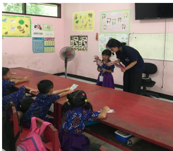
Gambar 3. Implementasi Media wayang

Tahap keempat yaitu implementasi. Pada tahap ini, media wayang kertas yang dibuat berdasarkan desain pengembangan sebelumnya diterapkan. Kegiatan implementasi dilakukan dengan menggunakan media wayang kertas dalam proses pembelajaran sesuai tema cerita hutan yang indah. Guru memanfaatkan media ini untuk membantu anak mengenal kosakata baru memulai kegiatan bercerita, tanya jawab, dan bermain peran menggunakan tokoh-tokoh wayang. Pelaksanaan pembelajaran dilakukan di kelas dengan melibatkan seluruh anak secara aktif. Alat dan bahan yang digunakan meliputi media wayang kertas, naskah cerita, dan perlengkapan pendukung kegiatan bercerita.