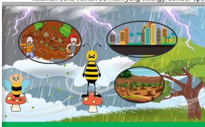
Gambar 4. Taman yang diterjang banjir