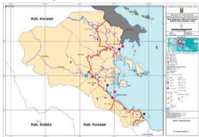
Gambar 2. Peta Struktur Ruang Wilayah Pesisir Konawe Utara

Berdasarkan hasil Programme for International Student Assessment (PISA) 2022 , Indonesia masih tertinggal dalam penguasaan keterampilan membaca, matematika, dan sains dibandingkan dengan negara-negara OECD. Indikator ini menunjukkan bahwa kualitas pendidikan di Indonesia perlu ditingkatkan, terutama dalam pengembangan kompetensi literasi. Literasi yang efektif tidak hanya terbatas pada keterampilan teknis, tetapi juga mencakup kemampuan berpikir kritis yang mendalam. Dengan latar belakang ini, penting untuk mengintegrasikan literasi kritis ke dalam kurikulum pendidikan anak usia dini (PAUD) agar anak-anak memiliki dasar berpikir yang kuat sejak usia dini. Gambar 2. Menunjukkan peta wilayah Pesisir Konawe utara sebagai berikut: