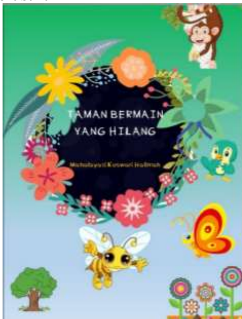
Gambar 3. Taman Bermain yang Hilang

Buku cerita bergambar tersebut dipilih karena memuat isu hilangnya ruang bermain akibat timbunan sampah dan aktivitas pertambangan, yang merupakan permasalahan nyata di sekitar lingkungan sekolah anak-anak akibat letaknya yang berada di kawasan pesisir. Permasalahan tersebut tidak hanya berdampak pada lingkungan sekitar, tetapi juga dapat menimbulkan konsekuensi yang lebih luas. Timbunan sampah yang tidak dikelola dengan baik, terutama apabila berakhir di lautan, berpotensi mengganggu ekosistem laut serta memberikan kontribusi terhadap pemanasan global dan perubahan iklim.